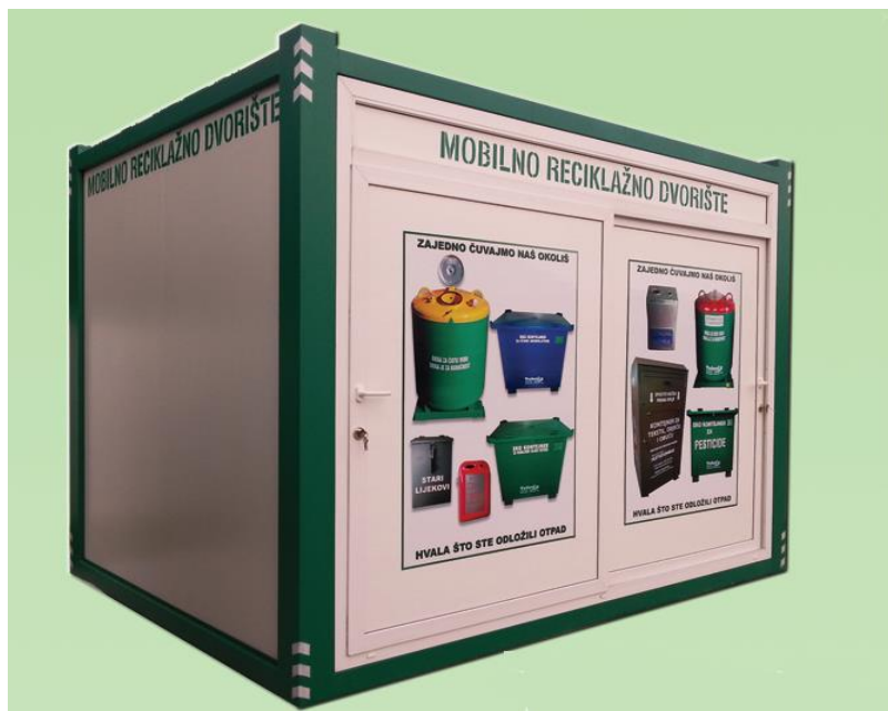
Slika 8.2.-2.: Primjer mobilnog reciklažnog dvorišta

Odlaganje otpada u samostalno mobilno reciklažno dvorište može biti omogućeno neprekidno, 24 sata. Mobilno reciklažno dvorište se premješta sa jedne lokacije na drugu svakih 14 dana.