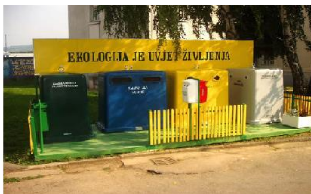
Slika 8.4.-1.: Primjeri zelenih otoka

U naselju Sutivan postavljeno je 5 zelenih otoka.